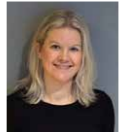
Seniorveileder i Bydel Stovner

Alle bydeler har en seniorveileder som tilbyr samtaler og veiledning om livet som seniorinnbygger i Oslo. Tilbudet er gratis. En seniorveileder kan møte deg for en samtale. Hva dere snakker om er opp til deg og kommer an på dine behov. Dere kan snakke om alt fra trygghet i hjemmet, sosialt nettverk, fysisk aktivitet eller hvilke tilbud og aktiviteter som passer for deg. Du kan få tips og råd om hvordan du kan få det bedre og tryggere hjemme med eventuell tilrettelegging. Målet er å styrke dine muligheter til å bo trygt hjemme og at du skal ha en aktiv og god hverdag.